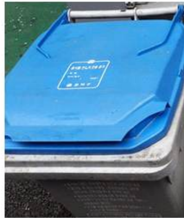
<Food waste boxes>