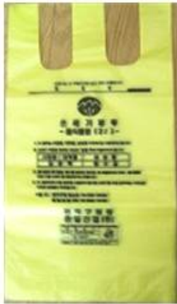
<Food waste bags>