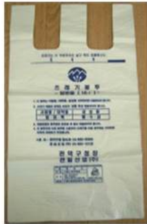
<General waste bags>